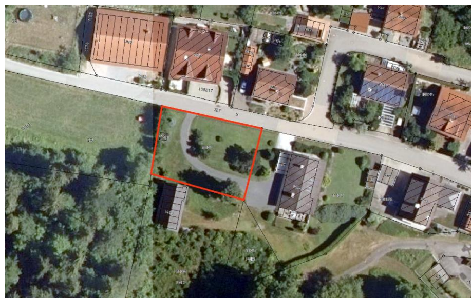
Abb. 2: Übersicht über das Plangebiet (Flst. Nr. 1110/3, rot umrandet).