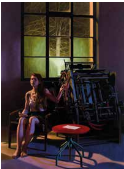
„Danae-Zeus-Automat“, 2017, Tempera/Öl auf Papier auf Sperrholz, 132 x 98 cm.

Eröffnung Freitag, 2. März 2018, 19.00 Uhr.