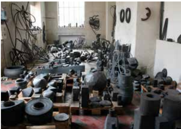
Atelier Markus F. Strieder, 2013, Foto: Künstler.

Art After Five 19. Januar 2018, 17.00 Uhr. Performance der Abteilung „Music & Movement“, Staatliche Hochschule für Musik Trossingen