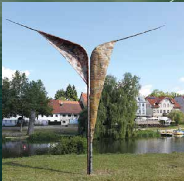
Donaugalerie 2014 mit Josef Bücheler, M13/05, 2005, Metall.

DONAUGALERIE steht für ein ambitioniertes Skulpturenprojekt in und um Tuttlingen, das im Jahr 2014 sein fulminantes Debut hatte. Über 14 Wochen hinweg werden Werke internationaler Größen neben Werken namhafter Künstler aus der Region im Freien zu sehen sein. Das Motto und die wesentliche Bezugsachse für die Skulpturenschau ist die Donau. Sie ist in Tuttlingen noch nicht weit von ihrem Ursprung entfernt. Hier hat sie noch einen weiten Weg vor sich, auf dem sie viele Landesgrenzen quert und verschiedenste Landschaften durchzieht, ehe sie ins schwarze Meer mündet. Es handelt sich um eine landschaftsprägende Wasserstraße mitten durch Europa, die für viele Regionen eine übergreifende Verbindung darstellt. Die jahrhundertlange Beziehung zu der besonderen Natur entlang der Donau prägt das Leben der Anwohner bis heute. Mit der Umgestaltung der innerstädtischen Donauvau zur Parkanlage geschah in Tuttlingen eine bewusste Hinwendung der Stadt zu „ihrem“ Fluss. Der im Jahr 2003 eingeweihte Donaupark ist somit Grundlage und Ausgangspunkt für die DONAUGALERIE, die mit neuen und ungewöhnlichen Sichtweisen die spannungsvollen Wechselbeziehungen von Kultur und Landschaft veranschaulicht und reflektiert. Jedes Kunstwerk entfaltet an seinem Ort Wirkung, verwandelt diesen und macht ihn auf neue Art erlebbar.