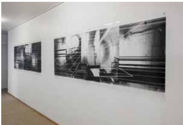
Parcours, 2016, Aceton auf Film, je ca. 80 x 240 cm.

Katalogpräsentation und Führung Mittwoch, 9. Mai 2018, 19.00 Uhr.