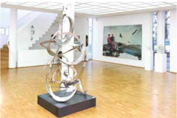
Jahresausstellung 2016.

Eröffnung Freitag, 30. November 2018, 19.00 Uhr.