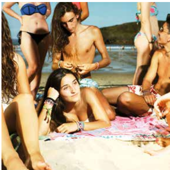
© Christiane von Enzberg, Celorio, 2015, Fotografie (analog), 100 x 100 cm.

Eröffnung Freitag, 22. Juni 2018, 19.00 Uhr.