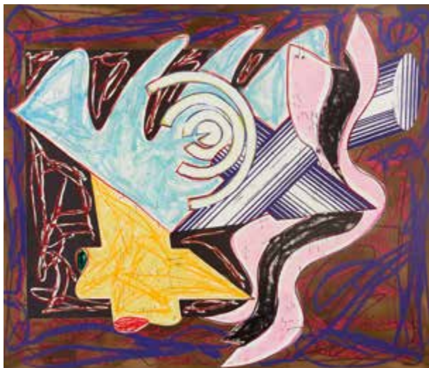
A Hungry Cat Ate Up the Goat, 1982-84, 116 x 136 cm. © Frank Stella / VG Bild-Kunst

Eröffnung Freitag, 5. Oktober 2018, 19.00 Uhr.