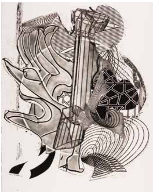
The Fossil Whale, State I, 1991, 168 x 132 cm.

Frank Stella (geb. 1936 in Malden, Massachusetts) studierte Kunstgeschichte und Malerei an der Phillips Academy in Andover, Massachusetts, und schloss später an der Universität von Princeton mit einem Bachelor of Arts in Geschichte ab. Frank Stella ist der einzige lebende Künstler, der mit zwei Retrospektiven im Museum of Modern Art New York geehrt wurde, und seine Werke befinden sich in den Sammlungen prominenter Museen der ganzen Welt. Frank Stella lebt und arbeitet in New York City.