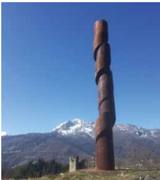
Rundsäule, 2016, Stahl, 505 x 50,5 x 50,5 cm.

Eröffnung Freitag, 18. Mai 2018, 19.00 Uhr.