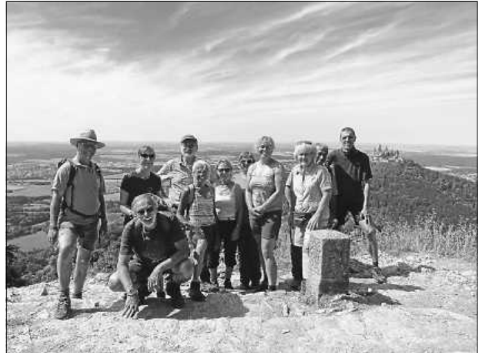
Vom Zeller Horn aus sieht man den Hohenzollern am besten.

Kante ein Teil des Weges verlief. Später ging die Wanderung höhenkonstant am Albtrauf entlang, wo sich immer wieder herrliche Blicke auf den nahen Hohenzollern wie auch ins weite Land bis hinüber zum Schwarzwald boten. Schließlich wanderte man wieder hinunter zum Startplatz, wo in einer urigen Wirtschaft die obligate Abschlusseinkehr erfolgte.