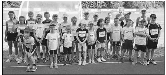
Möhringer KiLA-Team U8-U12

Am Start waren 68 Athletinnen und Athleten in 14 Teams der Kreisvereine TV Spaichingen, TV Möhringen, TG Schura und Gastgeber LG Tuttlingen-Fridingen.