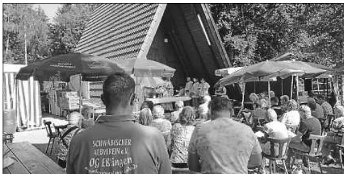
Gottesdienst vor der Hütte

Der Wettergott hatte dann ein Einsehen und schickte keinen Regen und er dämpfte auch die zur Zeit vorherrschende ungemütliche Hitze für diesen Tag etwas ab. Also stand einem regen Besuch nichts im Weg.