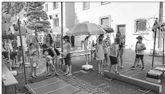
reges Treiben in der Spielstraße