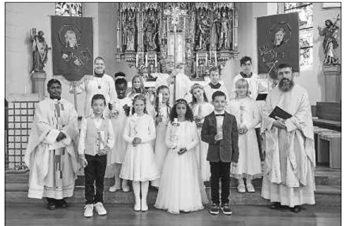
EKO Teil 1