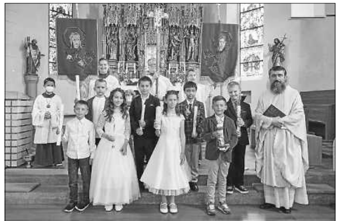
EKO Teil 2