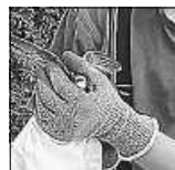
Der gerettete Vogel

An diesem Samstagvormittag wurden wir zu einer besonderen Rettungsaktion alarmiert. Ein Anwohner hatte bemerkt, dass sich ein Mauersegler mit einem Fuß in einer Dachrinne etwa 6 m über dem Boden verklemmt hatte und verständigte die Feuerwehr. Vor Ort stellte sich uns die Frage: Wie am besten an den kleinen gefiederten Patienten heran kommen? Die Dachrinne befand sich an der Gebäuderückseite, war also mit einem Fahrzeug nicht zu erreichen. Somit war eine Nachalarmierung der Tuttlinger Drehleiter schon mal keine Option. Nur über einen schmalen Durchgang und eine schmale Treppe konnte man in einen