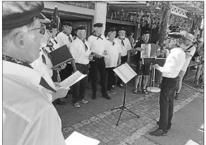
Der Seemannschor des Sängerkranzes am Städtlefestle