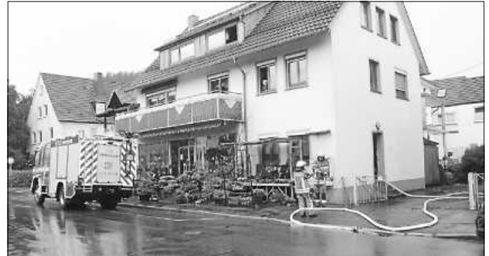
Wasser im Gebäude

Das LFKatS kümmerte sich währenddessen um einen Keller in der Anton-Braun-Straße, der ebenfalls einige Zentimeter unter Wasser stand. Anschließend fuhr dieses Fahrzeug zusammen mit dem MTW zu einem Industriebetrieb in der Kellenstraße. Dort staunten die Kameraden nicht schlecht, als man sie, statt wie erwartet in den Keller, auf die Dachterrasse schickte. Die dort vorhandenen Abflüsse waren mit dem Starkregen klar überfordert gewesen und daher stand die Terrasse deutlich unter Wasser, so dass wir auch hier tätig werden mussten. Gegen 16:30 Uhr waren dann alle Einsatzstellen abgearbeitet und die Geräte wieder gereinigt und die Einsätze somit für uns beendet.