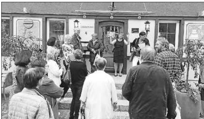
Der Verein Sängerkranz Möhringen feiert seine Schatzmeisterin!