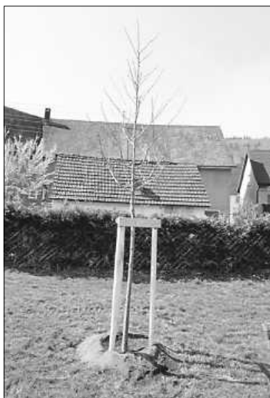
Erinnert an das Jubiläum: Ein Ginkgo-Baum.