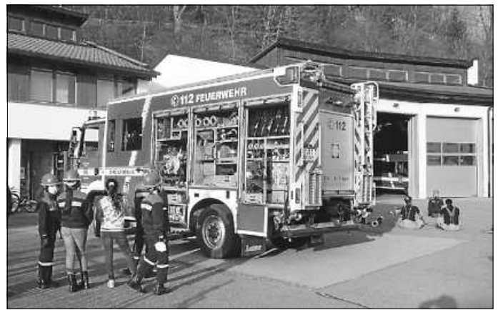
Erste Probe 2022

Am kommenden Montag findet die letzte Probe vor den Osterferien zur gewohnten Zeit am Gerätehaus statt.