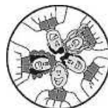
Kleiner Foto: Image

Liebe Ministranten, am Freitag, den 03. Dezember wollen wir Oberministranten einen Minitreff mit euch machen. Dazu treffen wir uns um 14:30 Uhr am Gemeindehaus St. Andreas Möhringen. An dem Mittag möchten wir mit euch ein paar schöne Spiele auf dem Pfarrhof machen, also zieht euch ein bisschen wärmer an. Auch werden wir dabei unseren neuen Pfarrer Jegani besser kennenlernen. Außerdem werden wir zu dieser adventlichen Zeit einen Kinderpunsch bereitstellen. Also bringt bitte eure eigene Tasse oder Becher mit. Wir Oberminis freuen uns schon auf euch. Bitte gebt kurz Bescheid, wer kommen möchte!