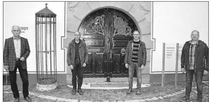
Die geehrten Blutspender nach der Ehrung