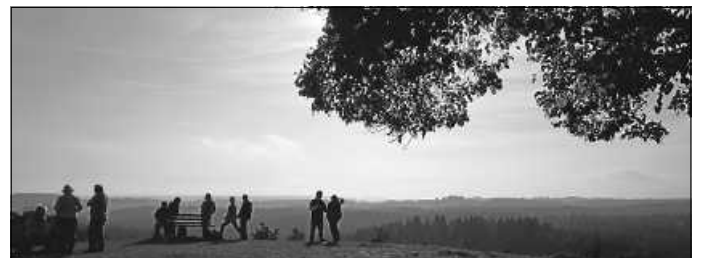
Herbststimmung auf dem Alten Berg

Diesmal schien die Sonne vom klaren, blauen Himmel und die Wanderer genossen noch eine knappe Stunde Ruhezeit an der Rundkapelle, bevor es zum Abschluss mit Sauerkraut und diversen deftigen Fleischspeisen in ein am Rückweg gelegenes Lokal ging.