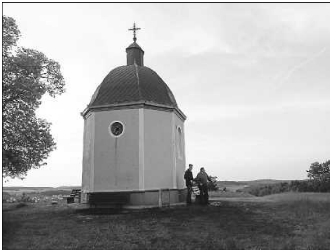
Rundkapelle bei Böttingen