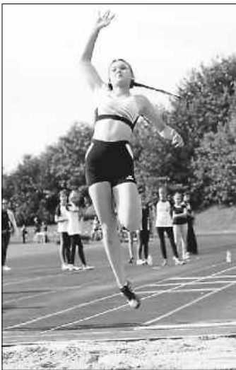
Emma beim Weitsprung

Als jüngste Teilnehmerin ging Luisa Weißgraf (W10) in 4 Disziplinen an den Start. Souverän und mit neuer persönlicher Bestleistung von 8,66 absolvierte sie den 50-m-Sprint und belegte damit Platz 2 in der Gesamtwertung. Mit 3,25 m im Weitsprung bestätigte sie ihre bisherige Leistung und kam auf Platz 6 von 12 Teilnehmerinnen. Ihr angestrebtes Ziel für den 800-m-Lauf , unter ihrer bisherigen Zeit zu bleiben, gelang ihr mit 3:27,81 zwar nicht ganz, dennoch kann Luisa mit Platz 3 der Gesamtwertung zufrieden sein. In den Kreis-Einzelwertungen wurde sie damit jeweils Kreismeisterin . Nicht ganz so optimal lief es für sie im Ballwurf , bei dem sie mit 14 m den 10. Platz belegte bzw. Platz 2 im Kreis . Insgesamt 3 Meistertitel erzielte Katharina Abt (W14) . Dies bedeutete in der Gesamtwertung den 3. Platz im 100-m-Sprint und der Zeit von 14,71 , ebenso Platz 3 im Weitsprung mit 4,20 m und Platz 2 im Kugelstoßen und der Weite von 7,91 m , wobei sie weit unter ihren Möglichkeiten blieb.