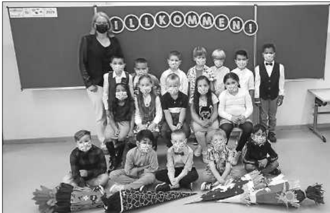
Klasse 1a (1 Kind fehlt)