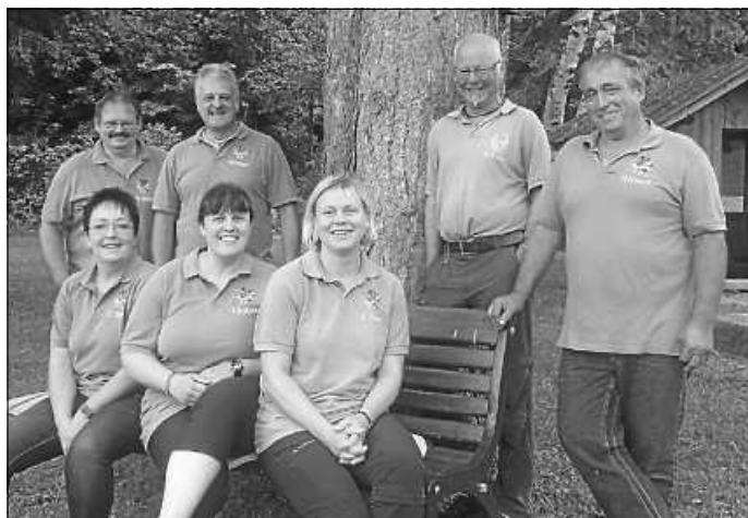
Der neue und alte Ausschuss