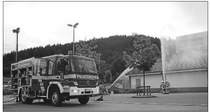
Probe Aldi Übungsobjekt Nr. 1

Die Feuerwehr in Möhringen dankt recht herzlich dafür, dass diese beiden tollen Übungsobjekte genutzt werden durften.