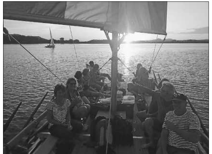
Ahoi, die Leichtmatrosen der Arche Joe

Um der Coronaverordnung nachzukommen, benötigen wir von allen Fahrgästen den Namen und die Telefonnummer.