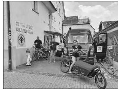
Waren für Seniorinnen und Senioren unterwegs: Die Teams der Jugendarbeit und des ASB.

Der Einkaufsservice war während des coronabedingten Lockdowns im März eingeführt worden, da Senioren als besondere Risikogruppe möglichst zuhause bleiben sollten. Deshalb suchten die Mitarbeiterinnen der Seniorenabteilung nach einer guten Lösung und organisierten gemeinsam mit der Jugendarbeit der Stadt und dem Arbeiter-Samariter-Bund den Einkaufsservice.