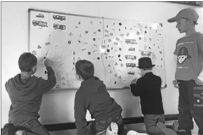
Mit kameradschaftlichen Grüßen, das Team der Kindergruppe Möhringen