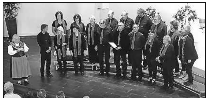
Der Sängerkranz in der evangelischen Kirche Bischofszell am 29.09.19

Singen für die Partnerschaft Sängerkranz beim Jubiläumskonzert in Bischofszell Städtepartnerschaften leben vom gegenseitigen Austausch und gemeinsamen Miteinander!