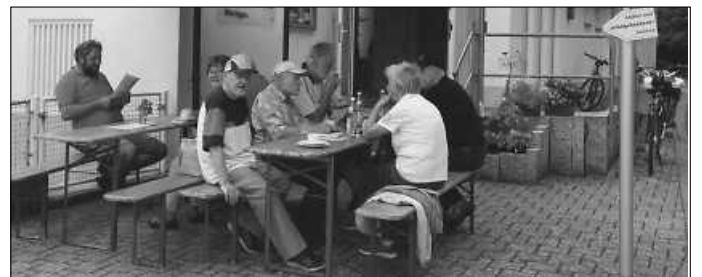
Gemütliche Einkehr in der Radfahrerkerche des Sängerkranzes Möhringen

Der Sängerkranz Möhringen bedankt sich bei allen Helferinnen, Helfern und bei all seinen Gästen!