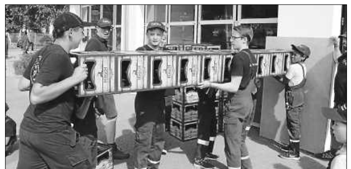
Kisten stapeln beim Lagerwettkampf

am vergangenen Wochenende nahmen wir von Freitagmittag bis Sonntagmittag am Kreiszeltlager in Seitingen-Oberflacht teil. Nachfolgend ein paar Bilder vom Kreiszeltlager. Ein ausführlicher Bericht folgt. Eines sei aber schon mal vorweg genommen: Unsere beiden Gruppen erzielten beim Lagerwettkampf nicht nur den 12. sondern auch noch den 1. Platz.