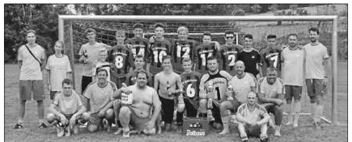
Die Finalisten NZ Möhringen und Stadthexen Tuttlingen (4:1)