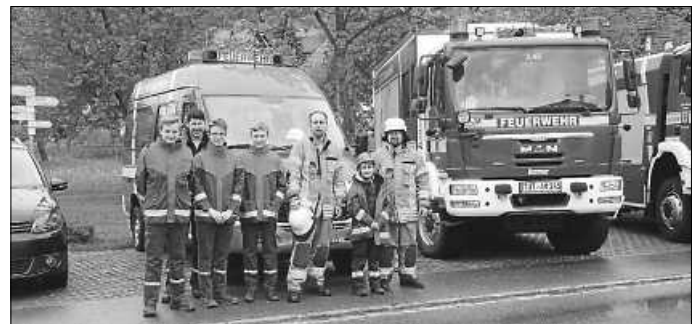
Mit kameradschaftlichen Grüßen die Leiter der Jugendfeuerwehr

Schwarzwaldstr. 50 78194 Immendingen Tel.: 07462 1531 Fax: 07462 26018