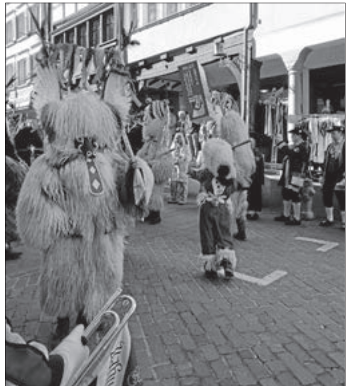
Ein Kurent aus Slowenien