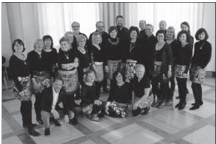
Schon Tradition hat das jährliche Probenwochenende des Möhringer Chors Salto Vocale in Ochsenhausen.

Probewochenende des Salto Vocale in Ochsenhausen Anfang Februar fand das alljährliche Probewochenende des Salto Vocale Chores in der Landesakademie Ochsenhausen statt. Ein ganzes Wochenende in den wunderschönen barocken Räumlichkeiten der ehemaligen Benediktinerabtei Ochsenhausen gemeinsam zu singen und zu proben ist ohne Zweifel einer der Highlights für den Salto Vocale! So wurde die Zeit wieder intensiv genutzt, um das neue Programm für das Konzert am 10. November in der Angerhalle Möhringen einzustudieren. Merken Sie also diesen Termin jetzt schon im Kalender vor! Sie werden überrascht sein, was wir musikalisch wieder alles auf die Beine stellen werden!