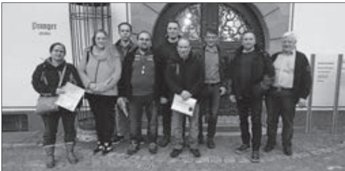
Die geehrten Blutspender nach der Ehrung.

Gefehlt haben: Erwin Stachnik und Ilse Benz.