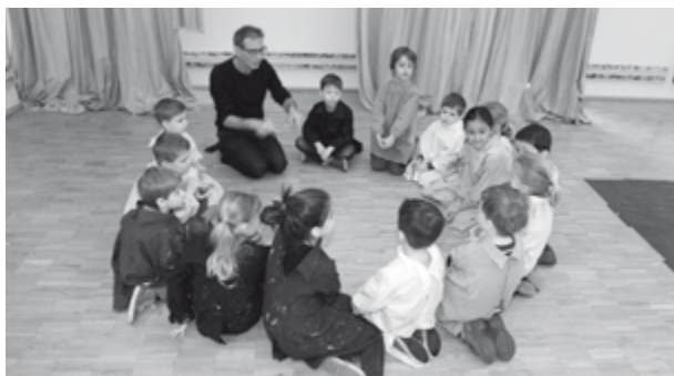
Kinderworkshop zur Ausstellung 3 französische Künstler, 2016.