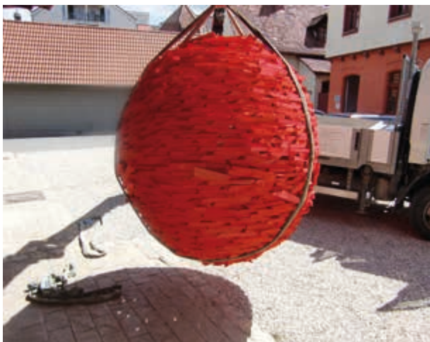
Fortbewegungsmittel (Nahverkehr) für Märchenbarone, 2013, Holz genagelt, Durchmesser 160 cm.

Eröffnung Freitag, 31. März 2017, 19.00 Uhr.