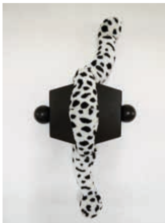
Caught in a System II, 2016, Mixed Media, 32 x 61 x 13 cm. Foto: Jürgen Müller

Eröffnung Freitag, 28. Juli 2017, 19.00 Uhr.