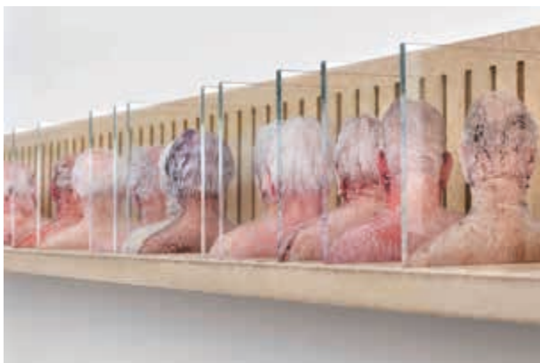
„Passe 2“ (Detail), 2014, Öl zwischen Glasscheiben, MDF-Regal, 12 x 12 x 101 cm.

Gestaltung: Ingrid Schorscher, Performance.