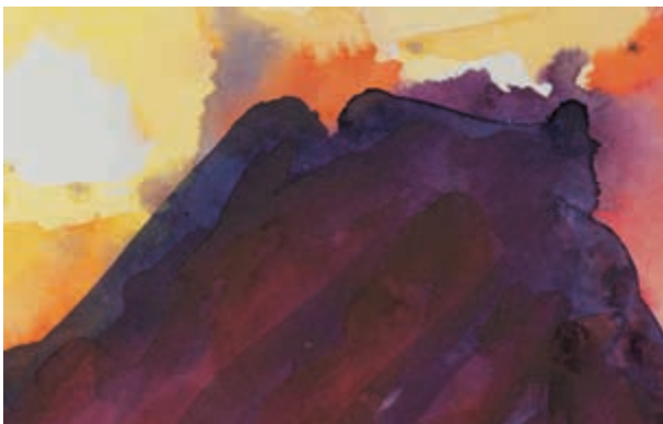
Feuerberg-Westafrika, Aquarell, 2001.

Tanz-Kunst-Klang mit dem Forum Tanz VS-Schwenningen (Cornelia und Walter Widmer).