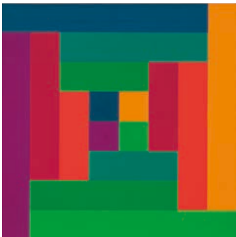
Richard Paul Lohse, Progression von Gruppen mit gleichen Farbmengen, 1967, Öl auf Leinwand, 64 x 64 cm.

Eröffnung Freitag, 12. Mai 2017, 19.00 Uhr.