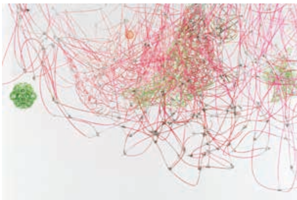
Rijswijk 2016.

Eröffnung Freitag, 15. September 2017, 19.00 Uhr.