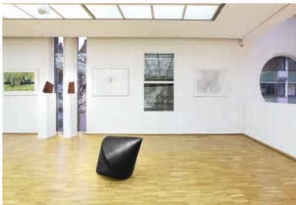
Galerie der Stadt Tuttlingen.

Eröffnung Freitag, 1. Dezember 2017, 19.00 Uhr.